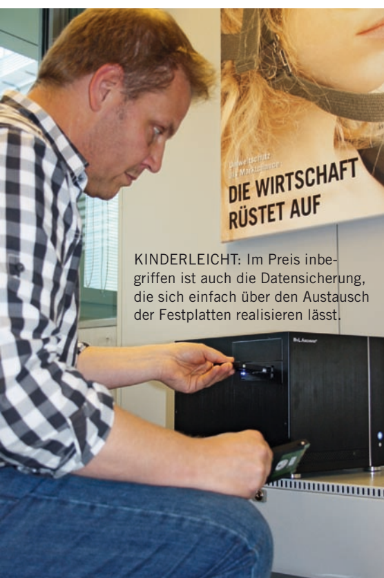
KINDERLEICHT: Im Preis inbegriffen ist auch die Datensicherung, die sich einfach über den Austausch der Festplatten realisieren lässt.